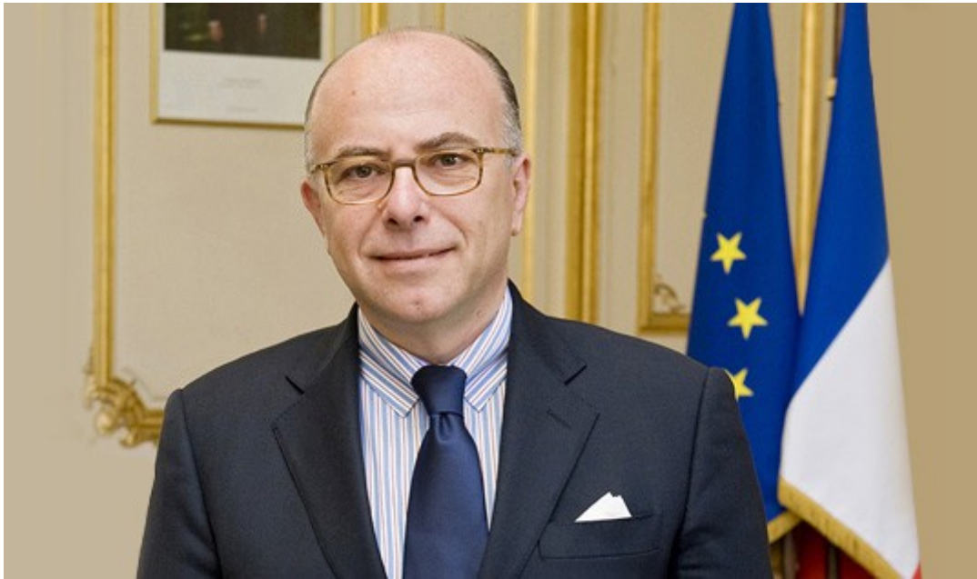
Bernard Cazeneuve Ministre de l'Intérieur