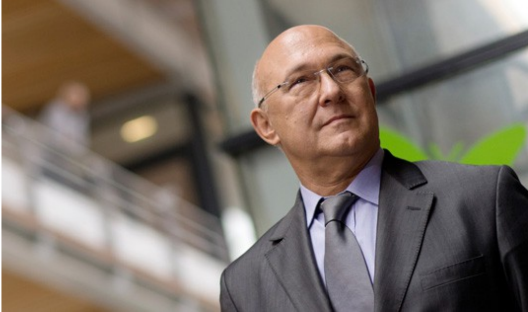
Michel Sapin Ministre des Finances et des Comptes publics