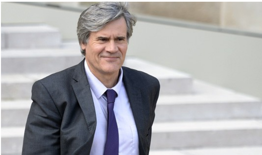
Stéphane Le Foll Ministre de l'Agriculture, de l'Agroalimentaire et de la Forêt, Porte-parole du Gouvernement