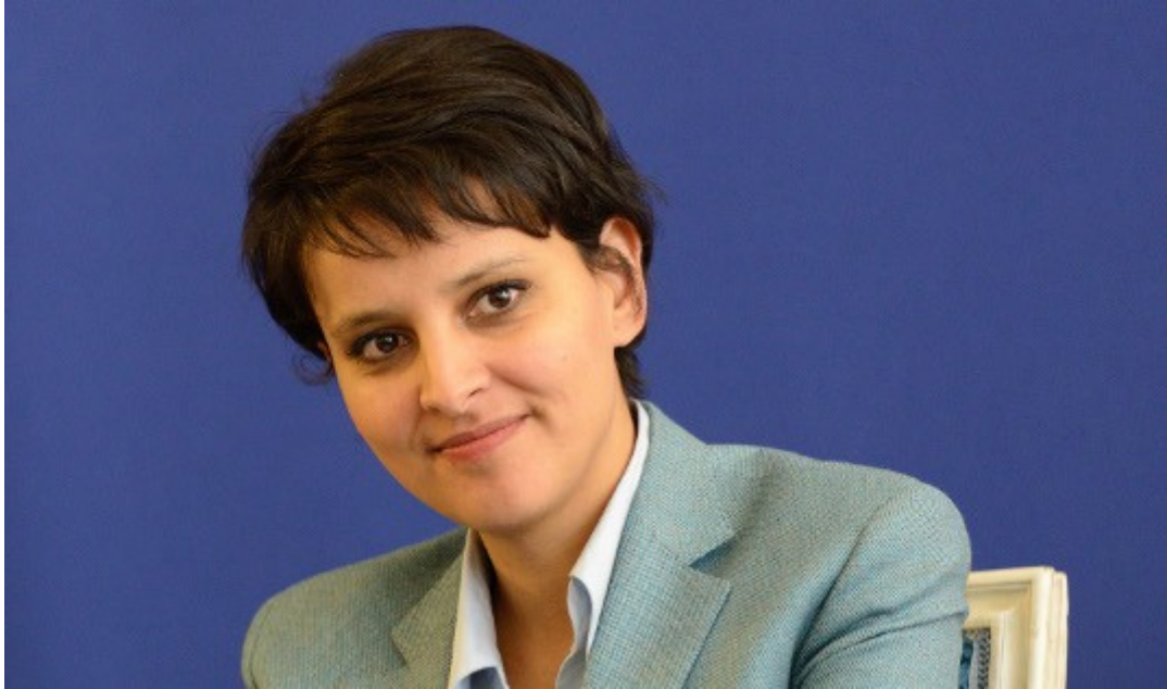
Najat Vallaud-Belkacem Ministre de l'Éducation nationale, de l'Enseignement supérieur et de la Recherche