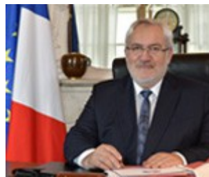
Jean-Marc Todeschini Secrétaire d'État auprès du ministre de la Défense, chargé des Anciens Combattants et de la Mémoire