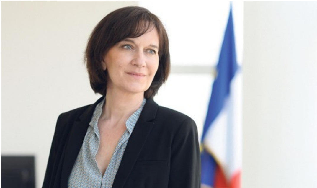
Laurence Rossignol Ministre de la Famille, de l'Enfance et des Droits des femmes