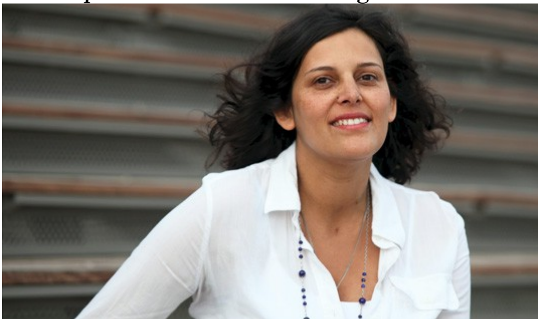
Myriam El Khomri Ministre du Travail, de l'Emploi, de la Formation professionnelle et du Dialogue social