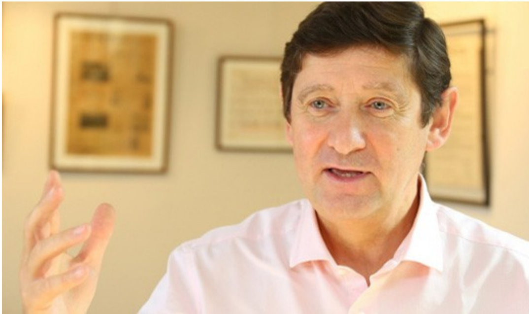
Patrick Kanner Ministre de la Ville, de la Jeunesse et des Sports