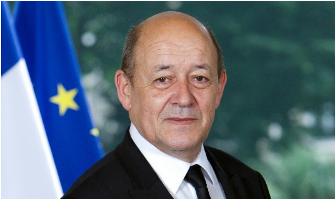
Jean-Yves Le Drian Ministre de la Défense