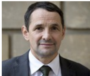
Thierry Mandon Secrétaire d'État auprès de la ministre de l'Éducation nationale, de l'Enseignement supérieur et de la Recherche, chargé de l'Enseignement supérieur et de la Recherche