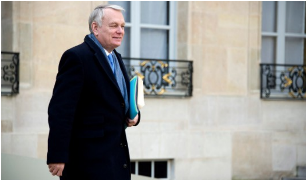
Jean-Marc Ayrault Ministre des Affaires étrangères et du Développement international