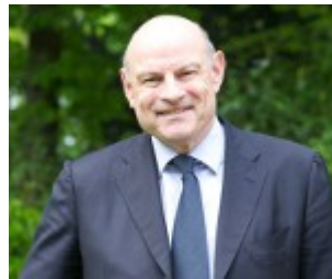
Jean-Marie Le Guen

Secrétaire d'État auprès du Premier ministre, chargé des Relations avec le Parlement