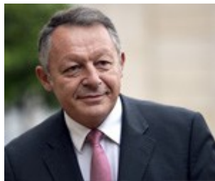
Thierry Braillard Secrétaire d'État auprès du ministre de la Ville, de la Jeunesse et des Sports, chargé des Sports