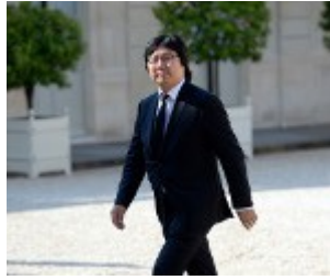
Jean-Vincent Placé Secrétaire d'État auprès du Premier ministre, chargé de la Réforme de l'État et de la Simplification