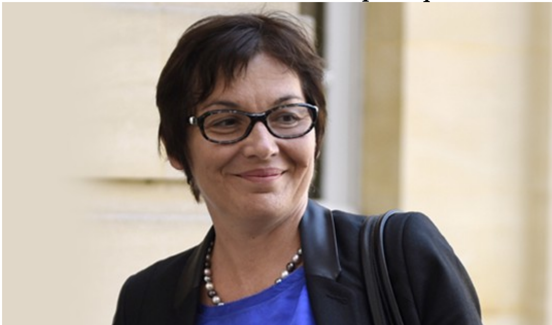
Annick Girardin Ministre de la Fonction publique