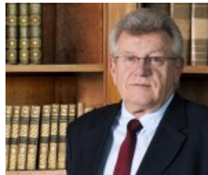
Christian Eckert Secrétaire d'État auprès du ministre des Finances et des Comptes publics, chargé du Budget