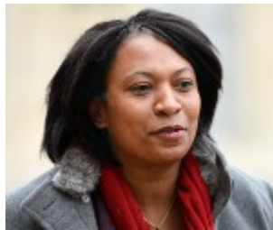
Hélène Geoffroy Secrétaire d'État auprès du ministre de la Ville, de la Jeunesse et des Sports, chargée de la Ville