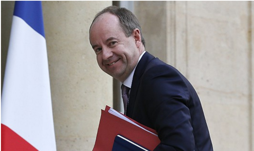
Jean-Jacques Urvoas Garde des Sceaux, ministre de la Justice