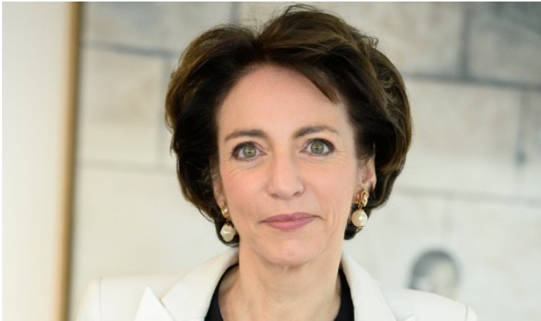
Marisol Touraine Ministre des Affaires sociales et de la Santé