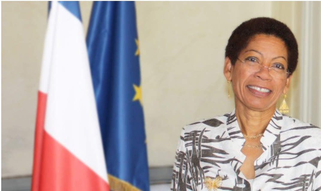
George Pau-Langevin Ministre des Outre-Mer