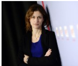
Juliette Méadel Secrétaire d'État auprès du Premier ministre, chargée de l'Aide aux victimes