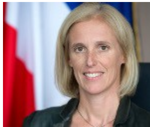
Ségolène Neuville Secrétaire d'État auprès de la ministre des Affaires sociales et de la Santé, chargée des Personnes handicapées et de la Lutte contre l'exclusion